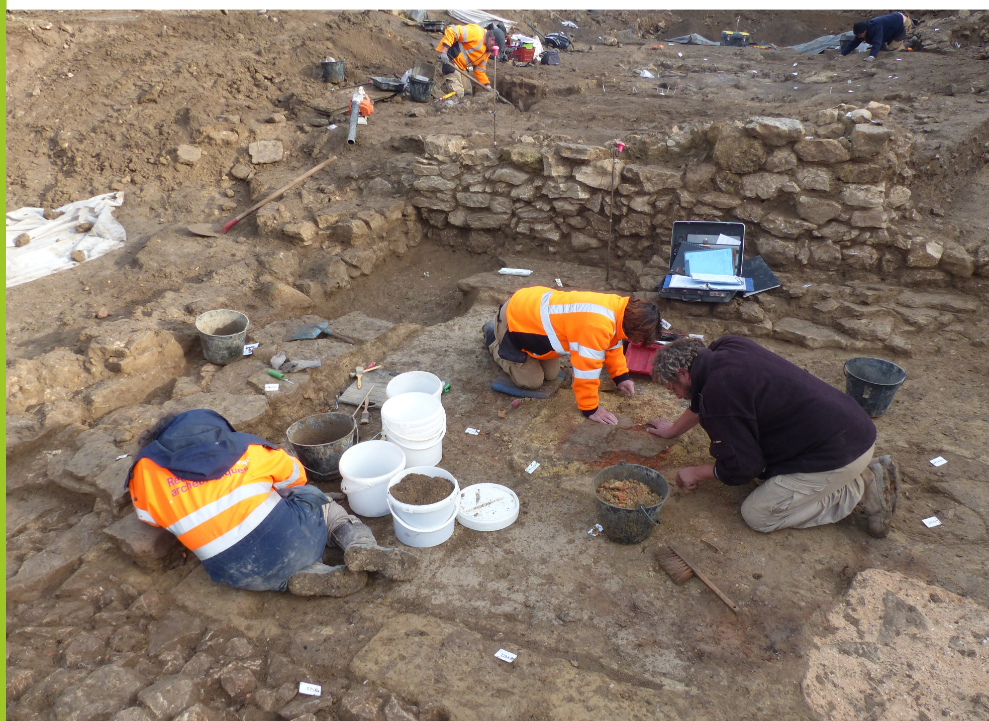
Maison du Ve siècle avant notre ère en cours de fouille, 2015 © Inrap.

Durant l'âge du Fer (VIIIe - Ier siècles avant notre ère) cette agglomération qui s'agrandit progressivement devient un oppidum (agglomération celte fortifiée, généralement de hauteur), connaissant différentes phases d'occupation plus ou moins intenses avec de légers changements du plan d'urbanisme (organisation en terrasses). Les vestiges datés de cette période, bénéficient d'un très bon état de conservation : structures bâties, sols et aménagements de surface, foyers, fours, banquettes ou encore très abondant mobilier céramique .