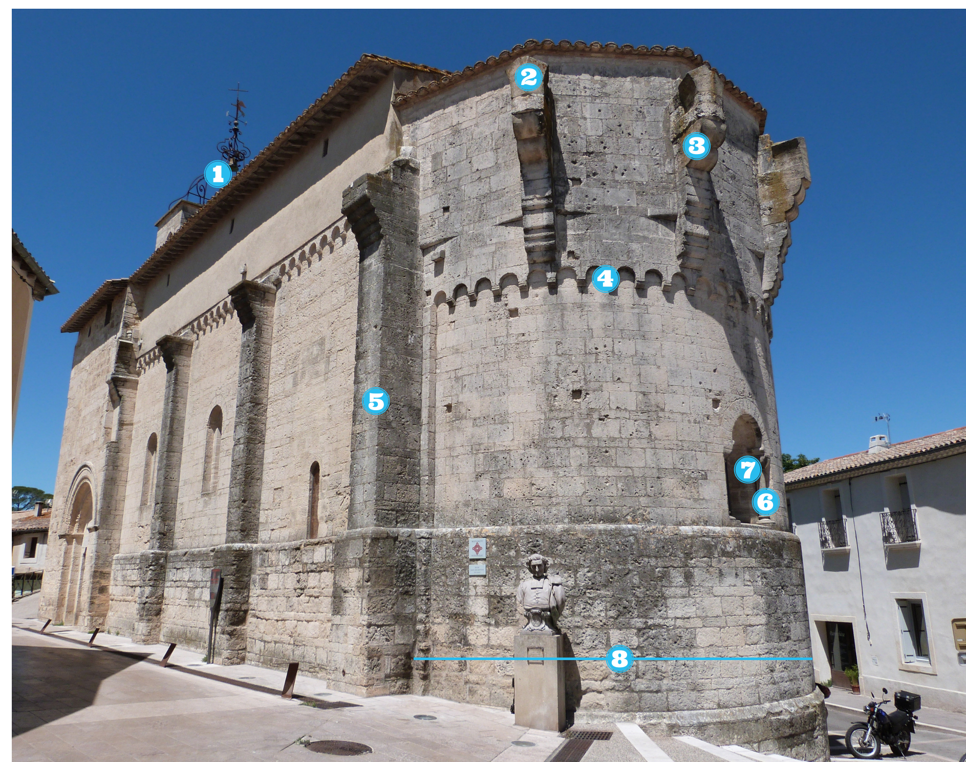
Église Saint-Jean-Baptiste

Dans les années 1990, les travaux de restauration à l'initiative de la Direction régionale des affaires culturelles (D.R.A.C.) et de la ville s'achèvent par la pose de neuf vitraux conçus par François Rouan et par l'installation du mobilier liturgique imaginé par Jean-Michel Wilmotte. L'église abrite une Crucifixion datée de 1687 de l'atelier du peintre montpelliérain Antoine Ranc (1634-1716).