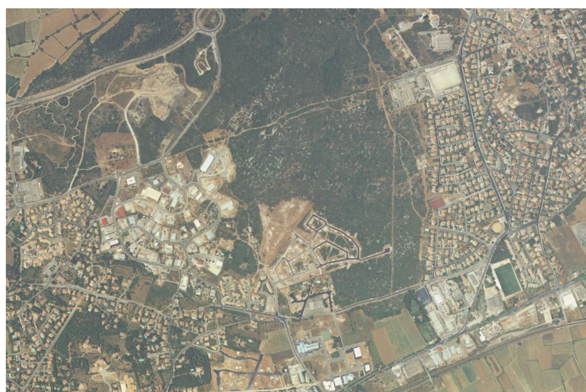
Vue aérienne de Castelnau-le-Lez, au centre de l'image, l'actuel quartier du Devois, 16 juin 1989, cliché argentique, C2844-0272_1989_FR4422_0009, détail.