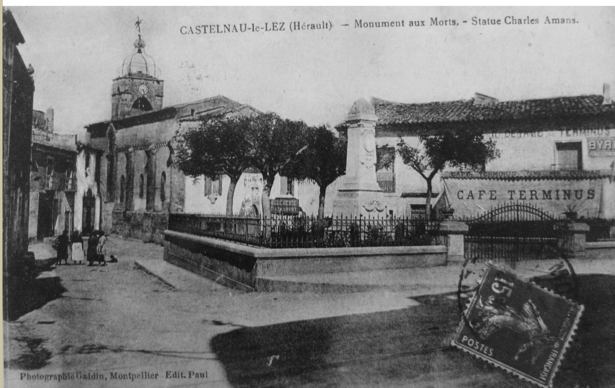
Carte postale "CASTELNAU-le-LEZ (Hérault) - Monument aux Morts - Statue Charles Amans", vers 1930 © Espace culturel Pierre Fournel, Ville de Castelnaud-le-Lez.

À partir de l'entre-deux-guerres, la commune commence à endosser un rôle de banlieue résidentielle de Montpellier ce qui accentue sa modernisation : électrification à partir de 1925, aménagement de lotissements dans les années 1930, goudronnage des rues à partir de 1936, etc.