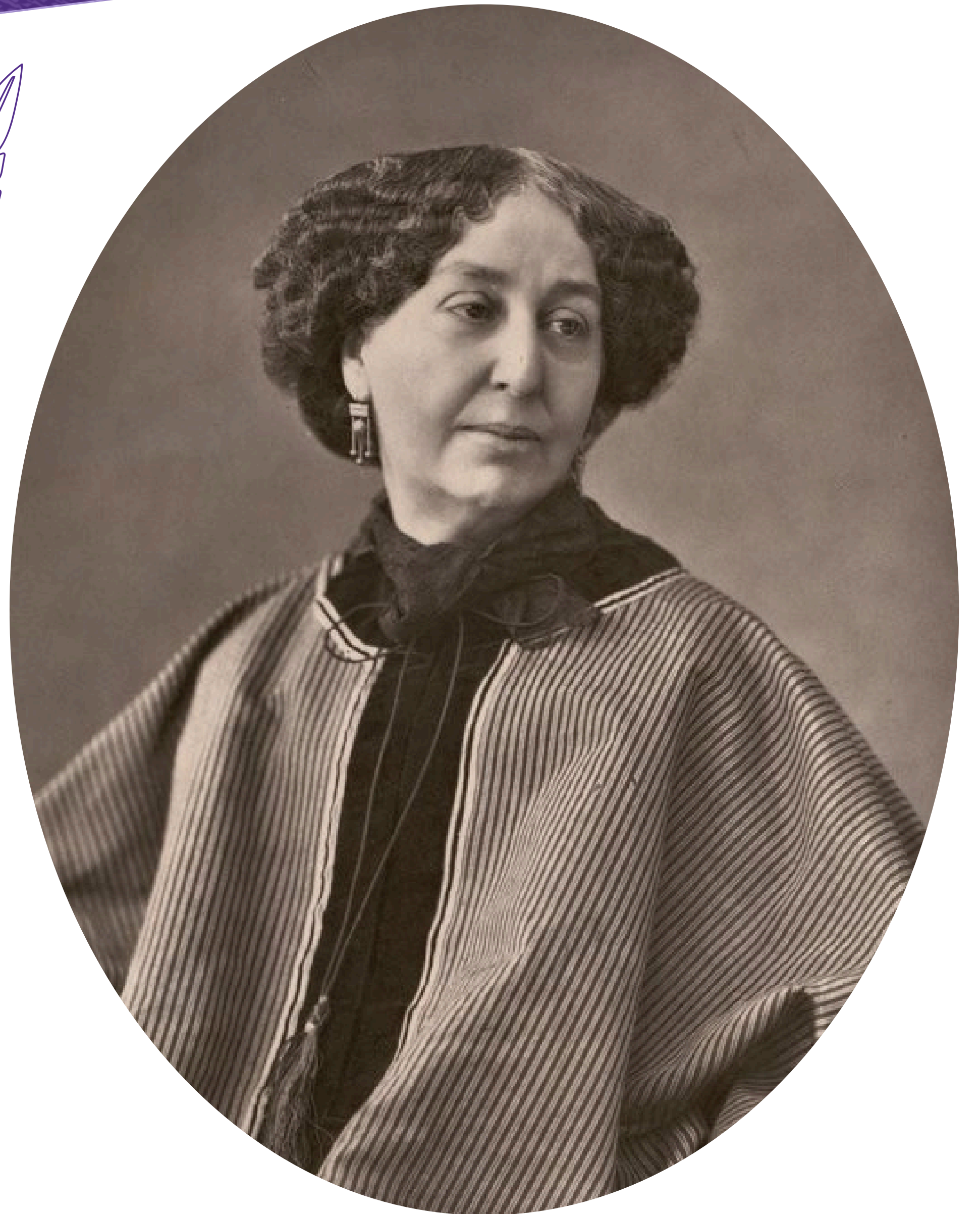
George Sand, Galerie Contemporaine, 126, boulevard Magenta

Figure incontournable de la vie intellectuelle de son temps, elle côtoie Honoré de Balzac, Eugène Delacroix, Marie d'Agoult, Franz Liszt ou encore Gustave Flaubert. Elle mène une vie indépendante au gré de ses passions, entretenant différentes liaisons amoureuses, notamment avec Alfred de Musset et Frédéric Chopin.